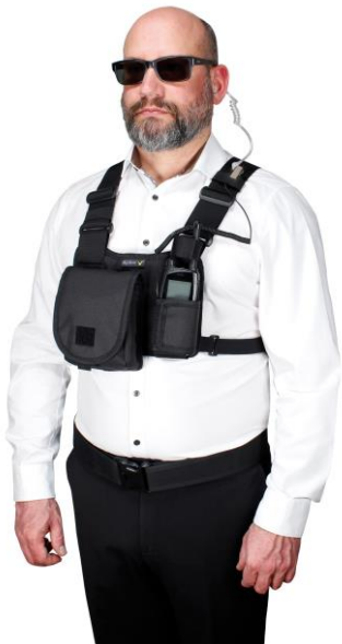
Anwendungsbeispiel: CHEST MOLLE mit Funkgerät, ohne Logo