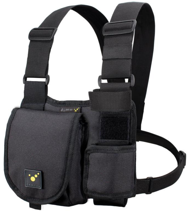
CHEST MOLLE Funkgeräte-Harnisch