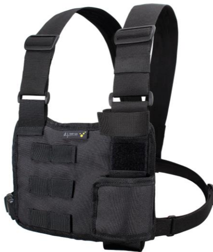
Ansicht: CHEST MOLLE mit abgenommenem Zubehörholster (im Lieferumfang enthalten)