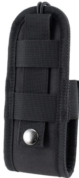
Ansicht Rückseite: MOLLE-kompatible PALS-Befestigung mit Druckknopf-Sicherung