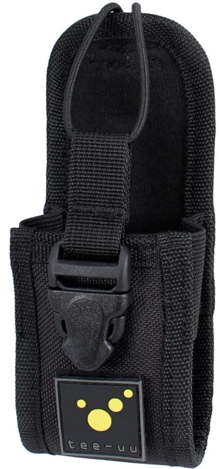
COM TAC Holster