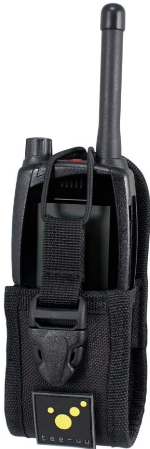
Anwendungsbeispiel: Holster mit HRT