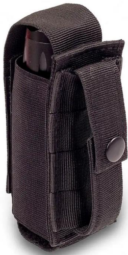
HOLD'S, schwarz: Rückseite mit PALS