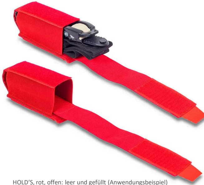
HOLD'S, rot, offen: leer und gefüllt (Anwendungsbeispiel)