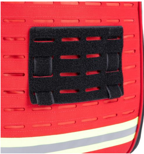
MMP MOLLE-Panel: Anwendungsbeispiel Größe L, schwarz an PARAMED'S XL Notfallrucksack