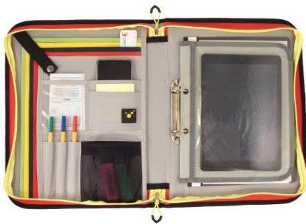
TABLET-FLAP Anwendungsbeispiel im BIG Organizer