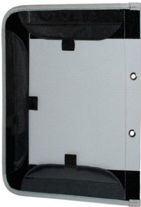
TABLET-FLAP: Rückseite mit Klettflächen für Größenanpassung